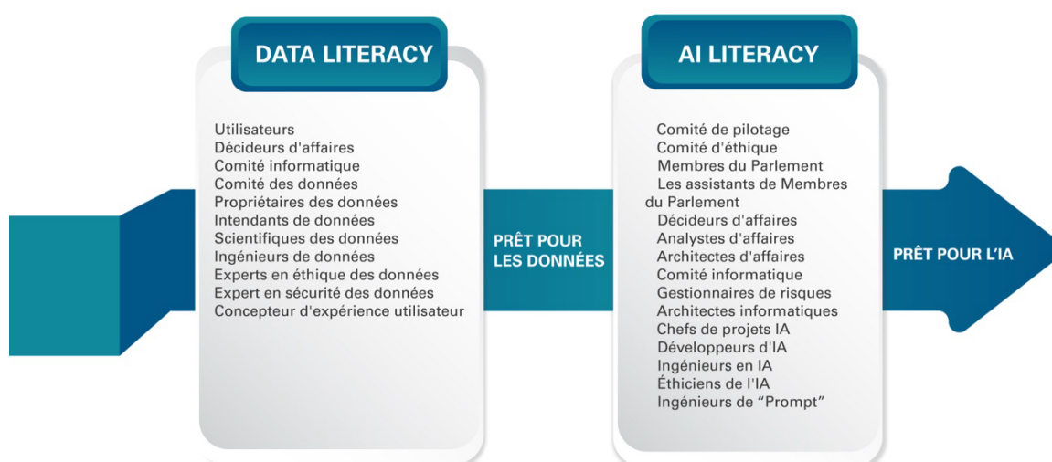
Figure 1 : Fonctions possibles à prendre en compte dans les programmes de formation à la maîtrise de l'IA et à la maîtrise des données

La figure ci-dessus souligne l'importance de lancer un programme de maîtrise des données avant de travailler avec l'IA et la raison pour laquelle les parlements doivent disposer d'un plan pour garantir de bons niveaux de maîtrise de l'IA.