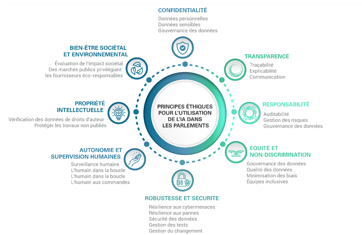
Figure 1 : Principes éthiques pour les parlements

Qu'il s'agisse de réduire les biais, d'assurer un contrôle efficace, de conserver une communication claire ou de protéger les données personnelles, ces principes se conjuguent pour créer un cadre global d'utilisation éthique de l'IA. En adhérant à ces principes, les parlements peuvent exploiter les avantages de l'IA tout en atténuant les risques, en renforçant la confiance des citoyens et en assumant leurs responsabilités démocratiques.