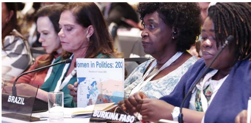
La participation des femmes à la vie politique est un droit humain et est essentielle pour promouvoir la justice et l'égalité des sexes.

La participation des femmes à la vie politique est un droit humain et est essentielle pour promouvoir la justice et l'égalité des sexes. Sans la participation pleine et égale des femmes, il n'est pas possible d'instaurer la démocratie, de garantir la paix ou de promouvoir le développement durable. Pendant trop longtemps, les femmes ont été empêchées d'être des partenaires à part entière dans la prise de décision, notamment au parlement. L'heure est venue d'adopter un nouveau modèle de gouvernance fondé sur le partage du pouvoir sur un pied d'égalité entre les femmes et les hommes.