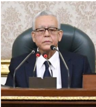
Mr. Hanafy Ali Gibaly, Speaker of the Egyptian House of Representatives

M. Hanafy Ali Gibaly, Président de la Chambre des représentants égyptienne