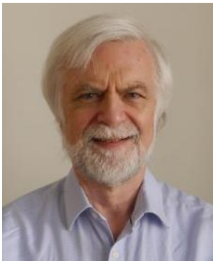
Mr. Jim Skea,

Professor, Imperial College of London, Lead Author of Intergovernmental Panel on Climate Change (IPCC) reports