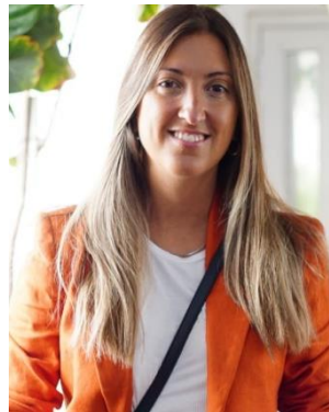
Ms. Maria Eugenia Catalfamo, Senator, Argentina

Mme Maria Eugenia Catalfamo, Sénatrice, Argentine