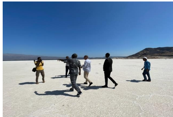
Lac Assal, Djibouti