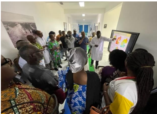
Observatoire régional de recherche sur l'environnement et le climat (ORREC), Djibouti

Une visite de terrain intéressante a été organisée par l'Assemblée nationale du Djibouti afin de sensibiliser les participants aux questions environnementales qui concernent la région, et mettre en exergue les actions menées dans le pays pour examiner et lutter contre les changements climatiques. Les participants ont pu visiter le lac Assal, le point le plus bas sur terre en Afrique, et l'Observatoire régional de recherche sur l'environnement et le climat (ORREC), un institut qui recueille d'importantes données pouvant éclairer les décisions politiques en matière d'adaptation et de résilience climatiques pour le pays et potentiellement pour toute la région d'Afrique de l'Est.