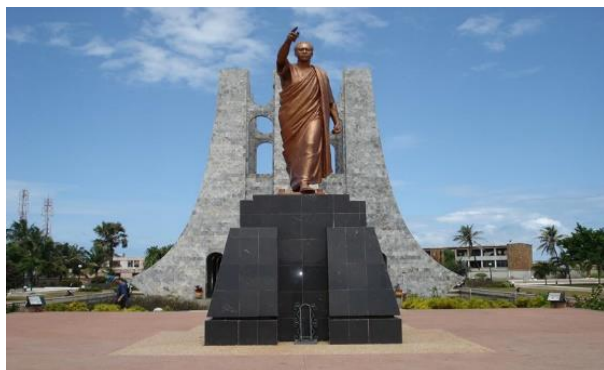
Mausolée de Kwame Nkrumah