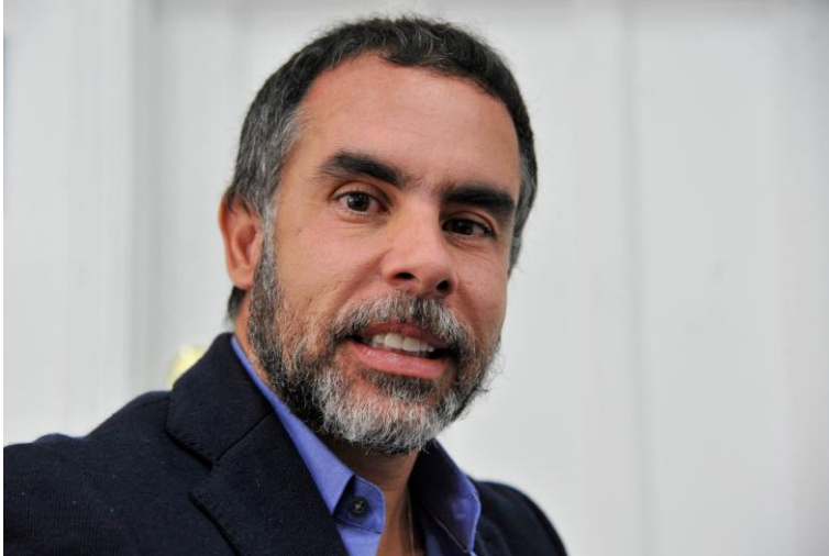
Armando Benedetti, sénateur colombien

Décision adoptée par le Comité des droits de l'homme des parlementaires à sa 176e session (Genève, du 3 au 19 février 2025)