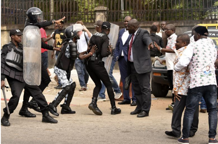
Des policiers anti-émeute (gauche) affrontent des membres du parti politique Générations et peuples solidaires (GPS) devant le siège du parti à Abidjan, le 23 décembre 2019, après l'intervention de la police pour évacuer des membres du parti.

Décision adoptée par le Comité des droits de l'homme des parlementaires à sa 176e session (Genève, du 3 au 19 février 2025)