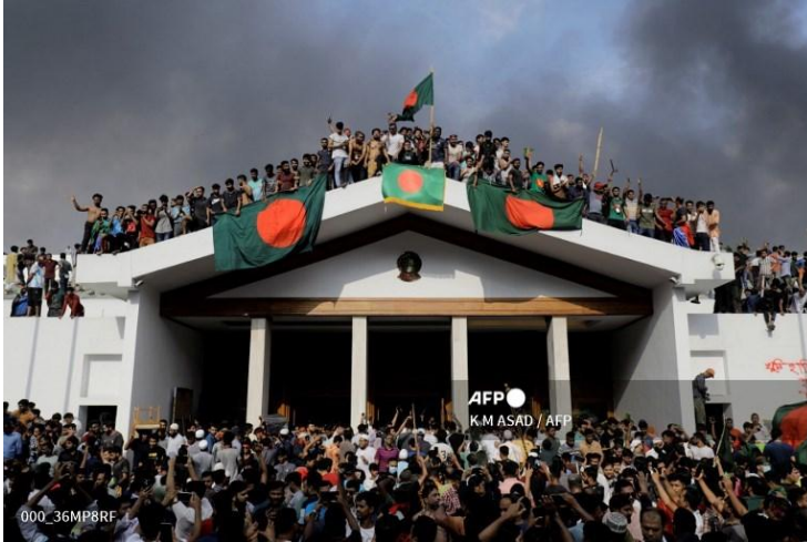
Des manifestants hostiles au Gouvernement brandissent le drapeau du Bangladesh alors qu'ils prennent d'assaut le palais de l'ex-Première Ministre Sheikh Hasina, à Dhaka, le 5 août 2024.- 000_36MP8RF

Décision adoptée par le Comité des droits de l'homme des parlementaires à sa 176e session (Genève, du 3 au 19 février 2025)