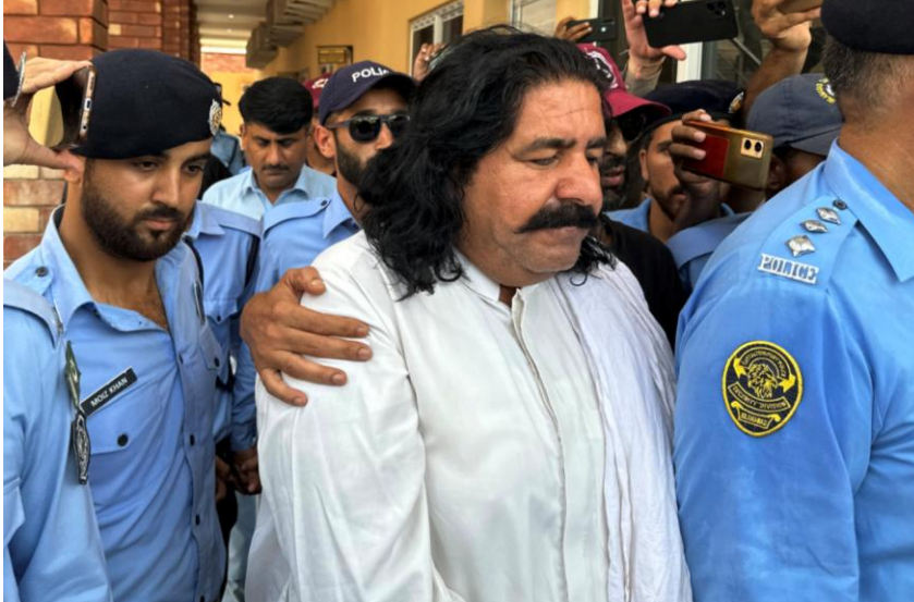
Des représentants de la police présentent l'activiste pachtoune des droits de l'homme et ancien membre de l'Assemblée nationale, M. Ali Wazir ( centre), après un rassemblement contre les disparitions forcées au Pakistan à Islamabad, le 20 août 2023.

Décision adoptée par le Comité des droits de l'homme des parlementaires à sa 176e session (Genève, du 3 au 19 février 2025)