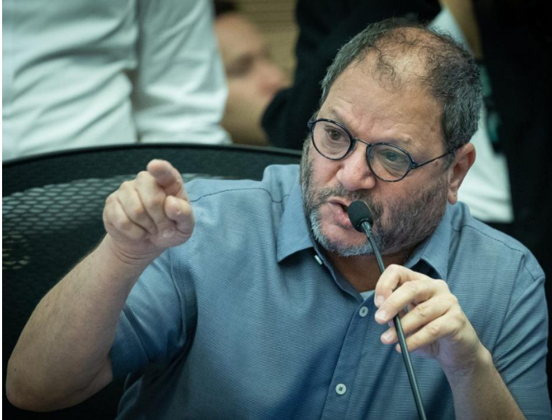
© Ofer Cassif, Membre de la Knesset

Décision adoptée par le Comité des droits de l'homme des parlementaires à sa 176e session (Genève, du 3 au 19 février 2025)