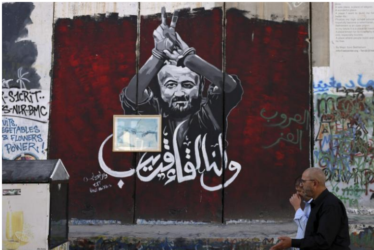
Des hommes passent devant une section de la barrière de séparation israélienne sur laquelle figure un portrait du Palestinien Marwan Barghouti, détenu dans une prison israélienne.

Décision adoptée par le Comité des droits de l'homme des parlementaires à sa 176e session (Genève, du 3 au 19 février 2025)