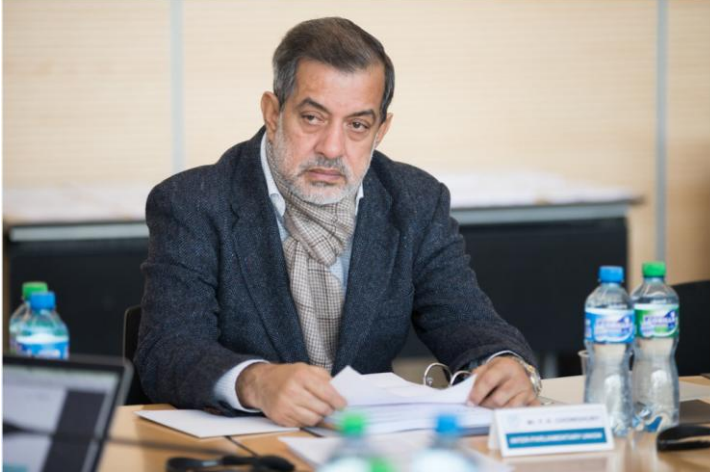
© UIP 138 - Comité des droits de l'homme des parlementaires (23 mars 2018)

Décision adoptée par le Comité des droits de l'homme des parlementaires à sa 176e session (Genève, du 3 au 19 février 2025)