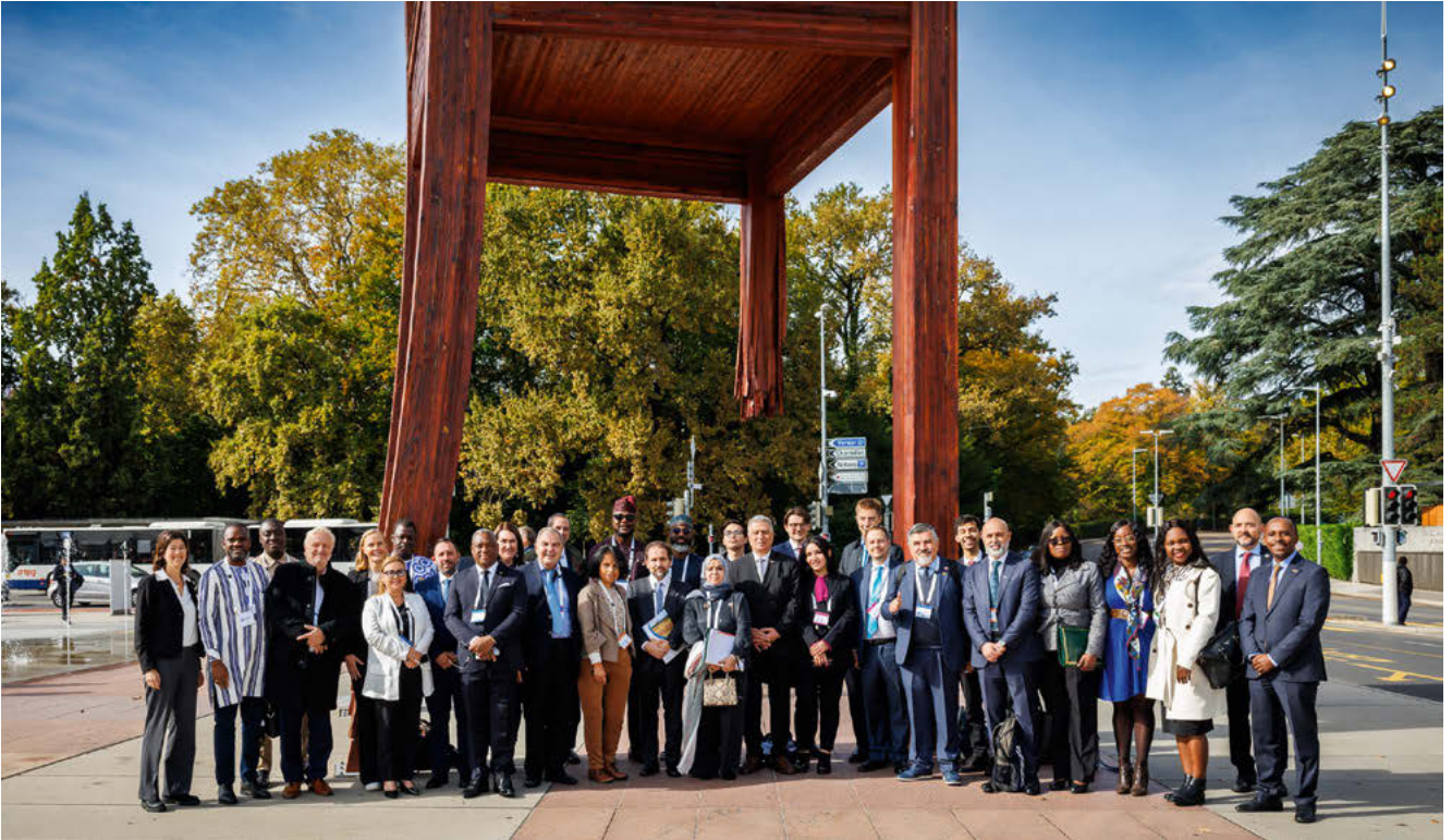
L'Envoyé spécial pour l'universalisation de la Convention sur l'interdiction des mines antipersonnel, le Prince Mired de Jordanie, entouré de parlementaires du monde entier sous la Chaise cassée à Genève lors de la 149 e Assemblée de l'UIP.

En mai, à la suite de la mission menée par le Secrétaire général de l'UIP en Arménie et en Azerbaïdjan, l'Organisation a facilité un deuxième cycle de discussions parlementaires de haut niveau entre les deux pays, soulignant ainsi le rôle essentiel de la diplomatie parlementaire dans les efforts de réconciliation. Les deux parties se sont engagées à poursuivre le dialogue dans le cadre du processus de paix qu'elles ont entamé. Pour plus d'informations, voir Partie 2 – Objectif politique 6.