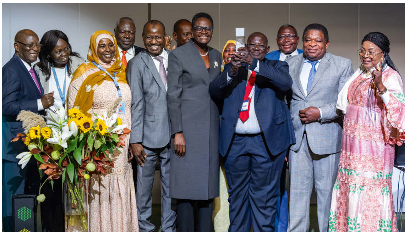
La délégation du Tchad reçoit le Prix Cremer-Passy 2024 au nom de M. Haroun Kabadi, Président du Conseil national de transition du Tchad.

Au moment de la rédaction du présent rapport, une autre conférence des dirigeants des parlements de transition était prévue au Gabon début 2025 et l'UIP réfléchissait également à un éventuel soutien à la Guinée et au Tchad.