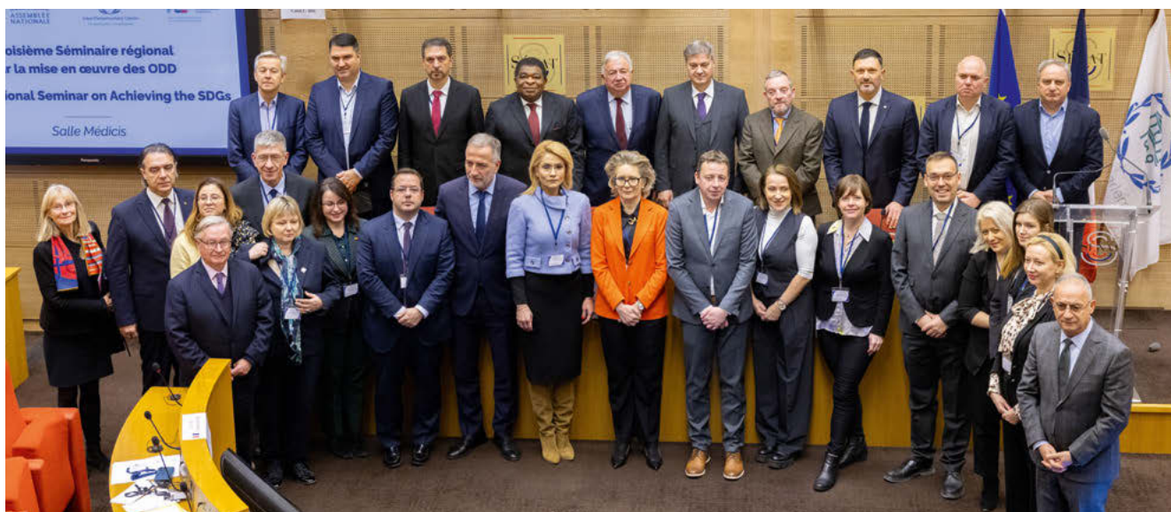
Le troisième Séminaire régional sur la mise en œuvre des ODD s'est tenu à Paris en janvier, sous l'égide du Sénat français.