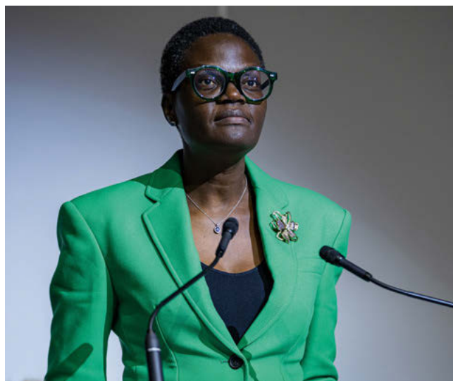
La Présidente de l'UIP, Tulia Ackson, lors de la 149 e Assemblée de l'UIP.

En dépit de ce piétinement en matière d'égalité des sexes, et avec le soutien de l'UIP, plusieurs pays ont réalisé des avancées notables. La Mongolie a amélioré son système de