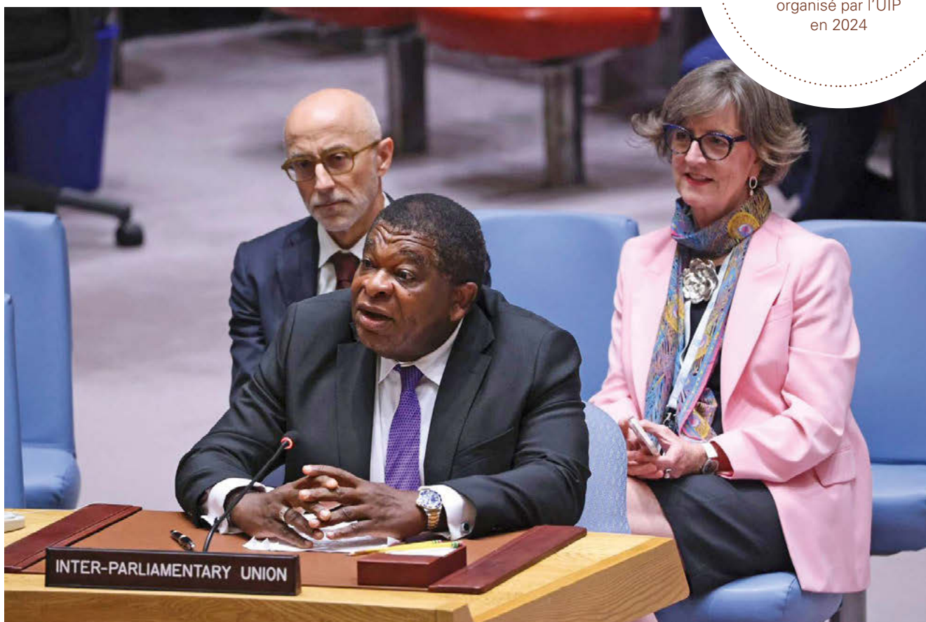
Le Secrétaire général de l'UIP, Martin Chungong, prend la parole devant le Conseil de sécurité de l'ONU en septembre 2024.

événements mondiaux, régionaux et nationaux organisé par l'UIP en 2024