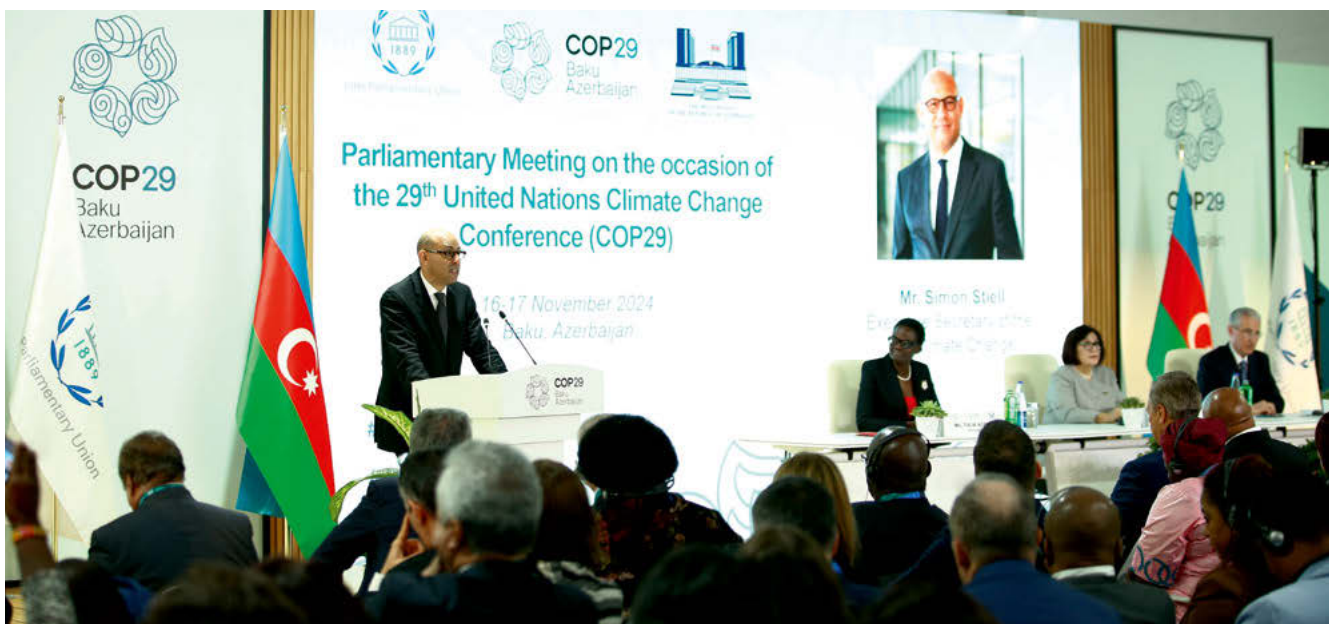
Le Secrétaire exécutif des Nations Unies pour les changements climatiques, Simon Stiell, prend la parole devant les parlementaires du monde entier lors de la Réunion parlementaire de l'UIP à l'occasion de la COP29.