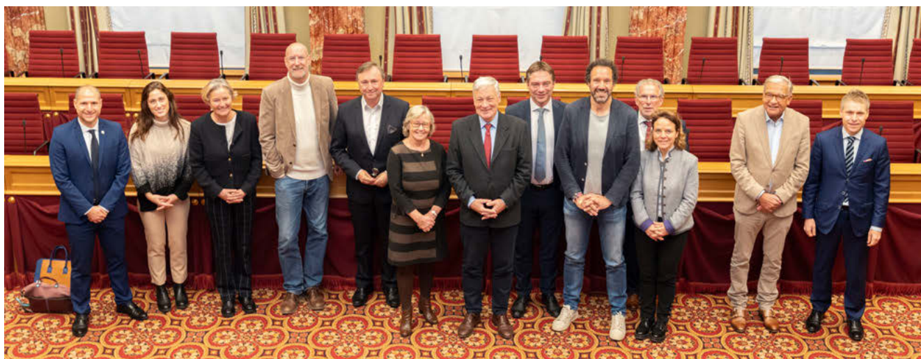
Novembre 2024, le Luxembourg entame une collaboration avec le Comité des droits de l'homme des parlementaires de l'UIP

En renforçant le contrôle parlementaire, l'action diplomatique et la recherche universitaire, le Luxembourg se pose en fervent défenseur des parlementaires du monde entier et renforce l'action de l'UIP.