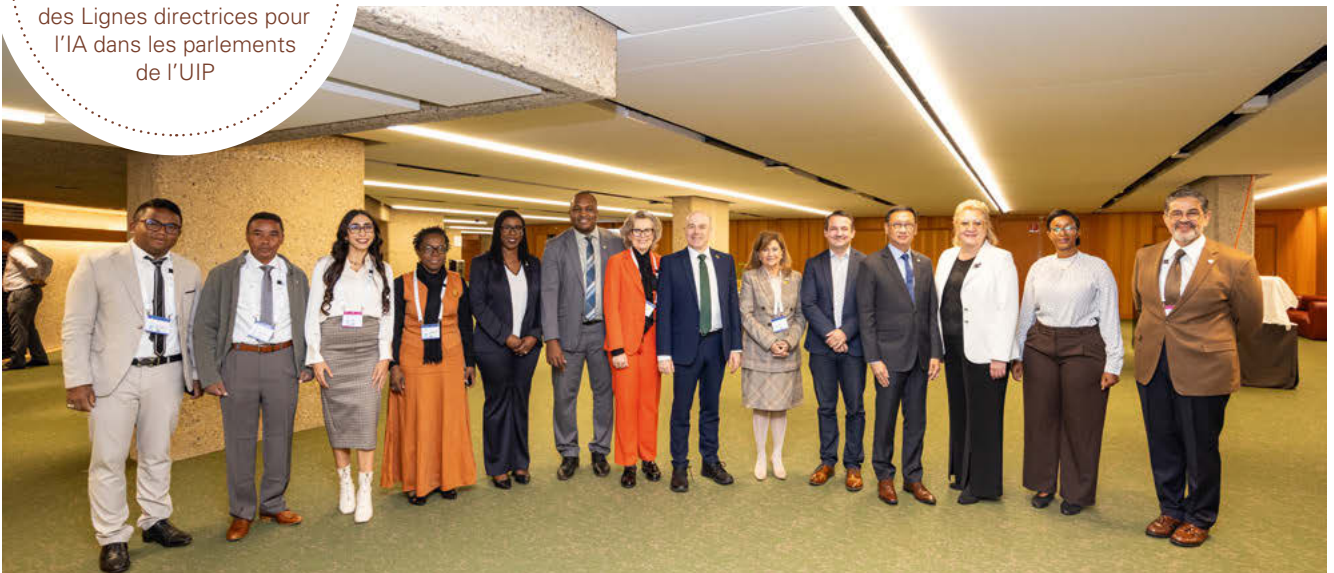
Membres du Groupe de travail de l'UIP sur la science et la technologie.

L'UIP a ensuite publié ses Lignes directrices pour l'IA dans les parlements , qui offrent un cadre général visant à aider les parlements à comprendre les technologies d'IA et à les mettre en œuvre de manière responsable et efficace. Elles soulignent que l'IA doit être utilisée pour améliorer les capacités humaines et non pour les remplacer, en particulier dans le contexte de la délibération et de la prise de décision démocratiques. Les Lignes directrices ont été complétées par une première série de Scénarios d'utilisation de l'IA dans les parlements , lesquels décrivent comment les parlements