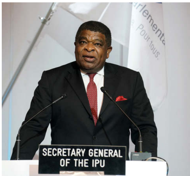
Le Secrétaire général de l'UIP, Martin Chungong, lors de la 149 e Assemblée de l'UIP.