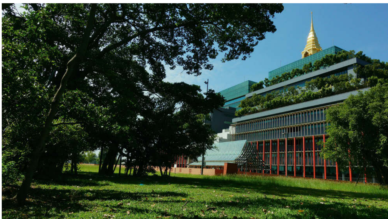
Le Parlement thaïlandais.

La Constitution thaïlandaise permet aux citoyens de proposer des projets de loi pour qu'ils soient soumis au débat parlementaire. En janvier 2022, plusieurs organisations de la société civile ont ainsi rédigé la première version d'un projet de loi sur la qualité de l'air et l'ont soumise au Parlement.