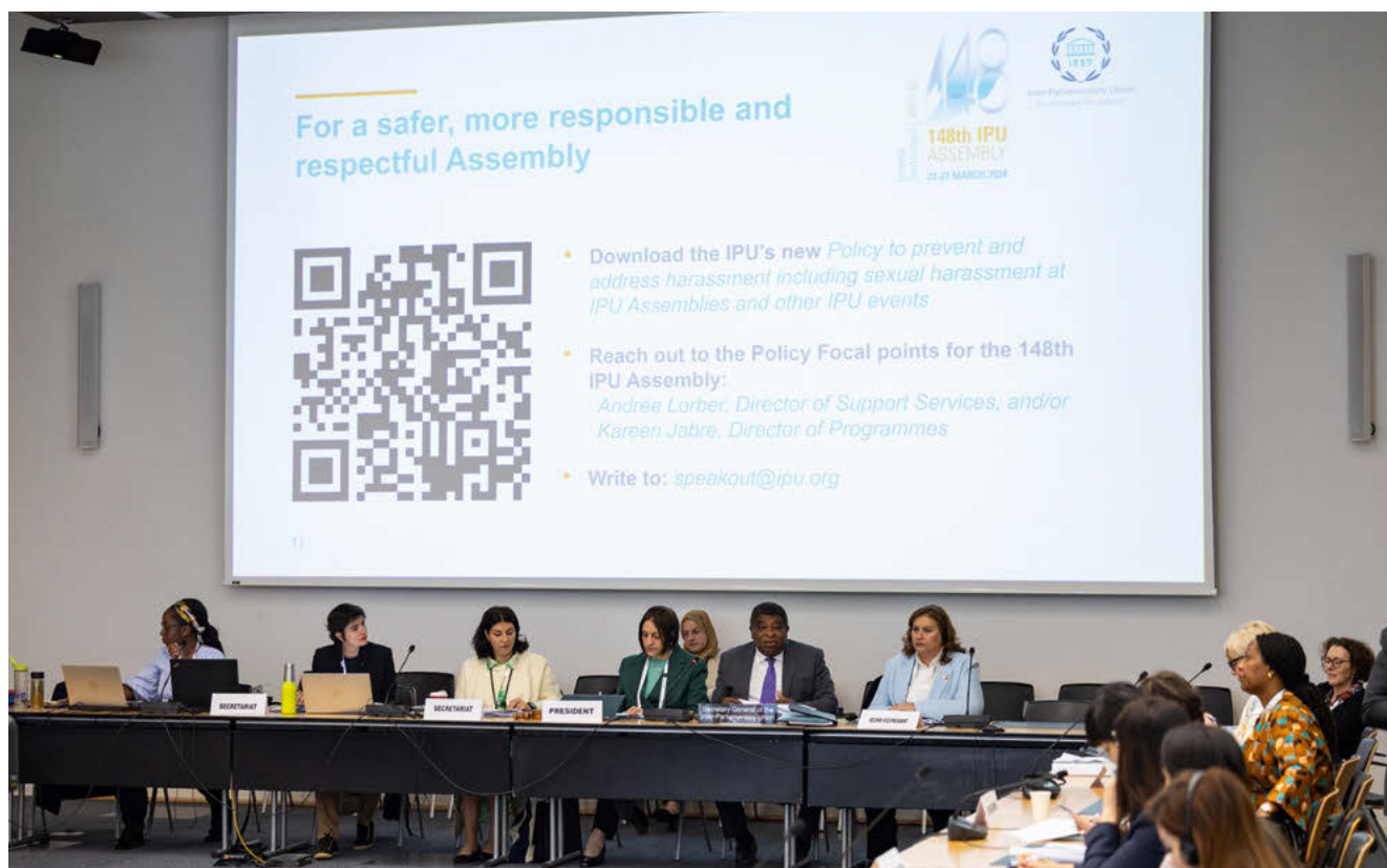
La nouvelle politique de lutte contre le harcèlement est diffusée lors de toutes les réunions de l'UIP.

Conformément à ses propres recommandations, l'UIP applique de nouvelles politiques internes pour se protéger contre les abus et la violence. Le Groupe de travail sur la transparence, la redevabilité et l'ouverture a continué de mettre en œuvre les recommandations formulées dans le Rapport sur la transparence d'avril 2020, dont la plupart ont été adoptées.