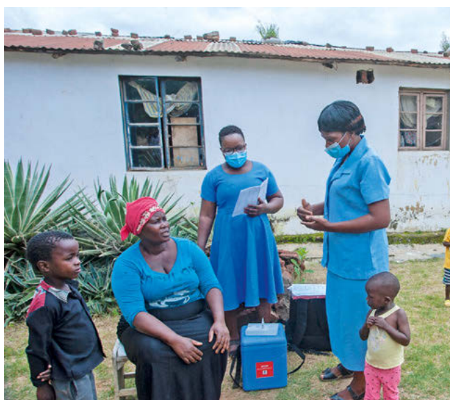
Centre de santé à Lilongwe (Malawi).

Ces dernières décennies, le Malawi est parvenu à réduire sensiblement ses taux de mortalité maternelle et infantile, mais les femmes, les enfants et les adolescents continuent de se heurter à toute une série d'obstacles dans l'accès à la