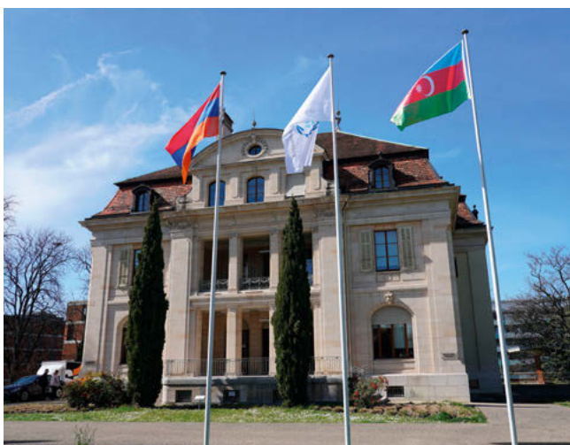
L'UIP a proposé à deux reprises en 2024 ses bons offices aux Présidents des Parlements d'Arménie et d'Azerbaïdjan..

Ceci est particulièrement vrai pour les parlementaires, qui ont le pouvoir de désamorcer les tensions et de façonner les récits. En tant que représentants du peuple, ils jouent un rôle fondamental dans l'instauration de la confiance, la promotion de la réconciliation et, en définitive, la ratification et la mise en œuvre des accords de paix.