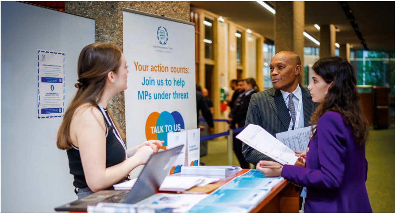
Stand des droits de l'homme de l'UIP lors de la 149 e Assemblée à Genève.

En mars, la 148 e Assemblée de l'UIP a adopté deux instruments majeurs, la Politique visant à prévenir et à éliminer le harcèlement, y compris le harcèlement sexuel, lors des Assemblées et autres événements de l'UIP , ainsi que le Code de conduite des responsables de la gouvernance de l'UIP . En outre, le Groupe de travail sur la transparence, la redevabilité et l'ouverture élabore actuellement une politique sur la protection des lanceurs d'alerte. La politique de lutte contre le harcèlement a été largement diffusée, le personnel de l'UIP a été formé en la matière et un cours en ligne obligatoire a été mis en place.