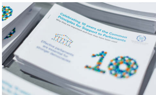
10 ans des Principes communs en matière d'assistance aux parlements.

Ce dixième anniversaire a été l'occasion d'évaluer les Principes communs et leur impact. Par exemple, l'Assemblée nationale de Zambie a fait en sorte que sa Commission des affaires respecte, dans sa composition, le Principe 4 («L'assistance aux parlements doit tenir compte de toutes les tendances politiques.»). La Commission, qui détermine l'ordre du jour parlementaire, comprend les présidents et les chefs de file des partis au pouvoir et de l'opposition ainsi que des parlementaires sans étiquette, ce qui favorise un processus décisionnel plus équilibré et plus représentatif.