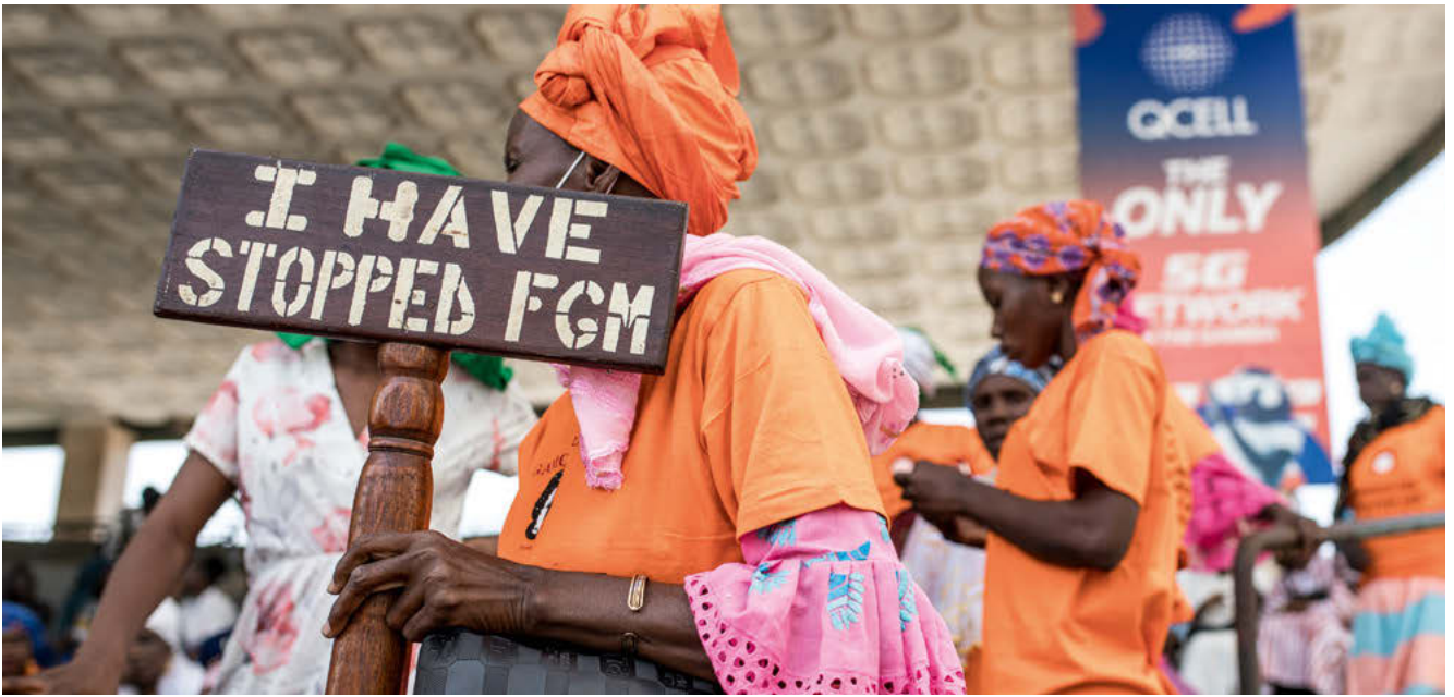
Une manifestante anti-MGF tient une pancarte devant l'Assemblée nationale à Banjul (Gambie).