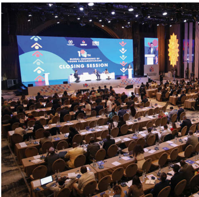
La dixième Conférence mondiale des jeunes parlementaires a été accueillie par le Parlement arménien en présence du Président et du Premier Ministre arméniens à Erevan.

M. O. Alao-Akala, parlementaire du Nigéria