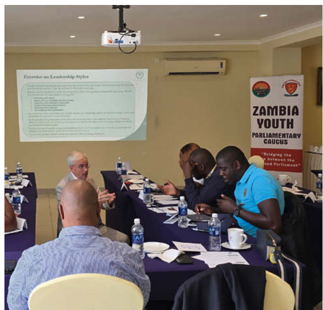
Une équipe de l'UIP s'est rendue en Zambie pour animer une formation de deux jours à laquelle ont participé 17 jeunes parlementaires.

La formation de l'UIP aidera les jeunes parlementaires à accroître leur efficacité en tant que responsables politiques et à faire en sorte que le Parlement zambien soit davantage à l'écoute de la jeunesse. Dans l'enquête réalisée après la formation, 100 % des participants se sont déclarés satisfaits du cours.