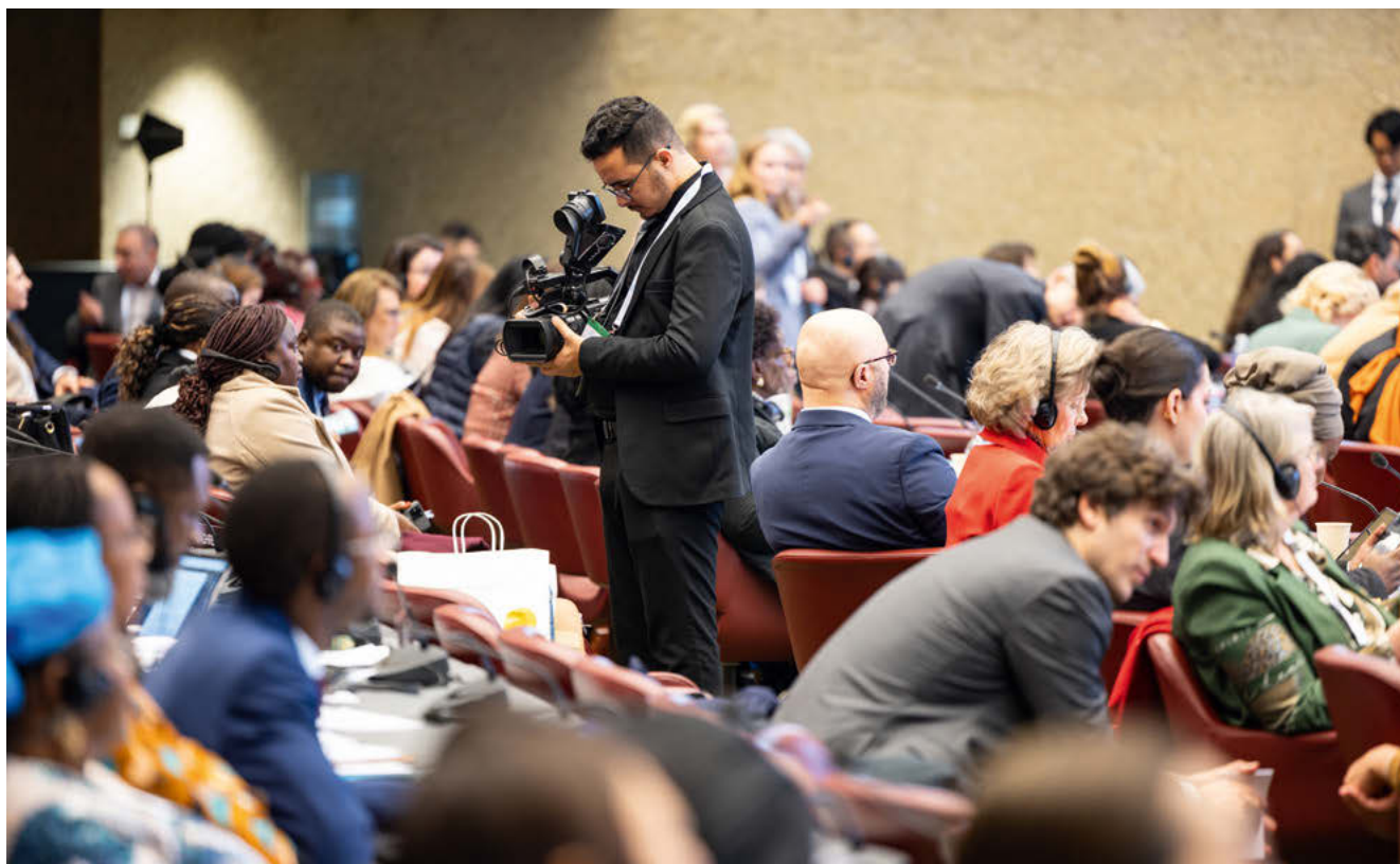
Forte présence médiatique lors de la 148 e Assemblée de l'UIP à Genève.