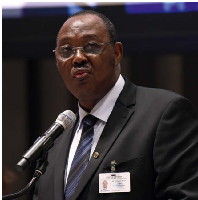
M. Haroun Kabadi lors de la quatrième Conférence mondiale des présidents de parlement de l'UIP.

Une autre forme de mobilisation a été mise en avant en 2024 : le travail exceptionnel en faveur de la paix et de la sécurité et du retour à l'ordre constitutionnel réalisé par le Président du Conseil national de transition du Tchad, M. Haroun Kabadi, qui s'est vu décerner le prix Cremer-Passy, du nom des fondateurs de l'UIP.