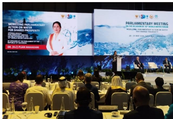
Atelier parlementaire à l'occasion du 10 e Forum mondial de l'eau (2024)

L'UIP convoque également des séminaires régionaux et interrégionaux sur le sujet des ODD, offrant aux parlements une plateforme pour échanger leurs expériences et bonnes pratiques adaptées aux priorités communes. Ces événements sont des espaces de transmission du savoir entre pairs, de coordination et de résolution conjointe des problèmes. En parallèle, l'Organisation soutient l'engagement parlementaire à l'échelle mondiale, y compris au moyen de réunions parlementaires régulières en marge des conférences climatiques (COP), à l'occasion desquelles les parlementaires peuvent prendre directement part aux négociations mondiales sur les politiques climatiques et plaider pour des actions nationales plus ambitieuses et inclusives. L'UIP contribue également à renforcer