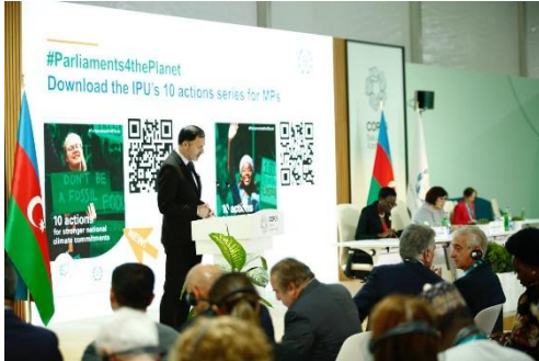
Réunion parlementaire à l'occasion de la COP29 (2024)

S'appuyant sur son portfolio d'actions climatiques, l'UIP a récemment lancé un nouveau projet mondial axé sur le renforcement des capacités parlementaires en matière de réduction des émissions de méthane – une priorité climatique urgente conforme au Pacte mondial sur le méthane. Le projet, un partenariat avec le Parlement andin, vise à combler les lacunes en matière de connaissances et de capacités en développant des ressources sur mesures, en facilitant les échanges interparlementaires et en favorisant la promotion de l'action législative en faveur de la réduction du méthane. Ces efforts s'intègrent dans la stratégie plus large de l'Organisation visant à renforcer les parlements en tant qu'institutions, favorisant l'inclusivité, la redevabilité et la résilience. En fournissant aux parlements les outils, connaissances et réseaux dont ils ont besoin pour agir de manière décisive, l'UIP aide à veiller à ce que les institutions législatives ne soient pas de simples observateurs, mais jouent un rôle de chef de file dans l'impulsion mondiale en faveur du développement durable.