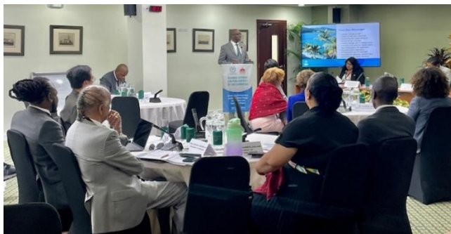
Séminaire régional pour les parlements des Caraïbes (2024)

Outre la publication de ressources et d'outils visant à améliorer les connaissances, l'UIP offre un soutien direct aux parlements en matière de renforcement des capacités, en mettant l'accent sur les pays en développement. Par exemple, l'Organisation a récemment apporté une assistance technique à des commissions parlementaires au Malawi et en Zambie afin de renforcer leurs fonctions législative, budgétaire et de contrôle en matière de santé des femmes, des enfants et des adolescents. En parallèle, en Gambie, l'UIP a joué un rôle essentiel en soutenant les efforts de l'Assemblée