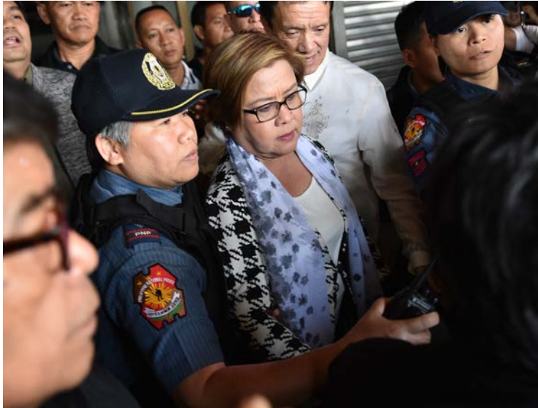
La sénatrice Leila de Lima est escortée par les policiers suite à son arrestation au Sénat à Manille le 24 février 2017