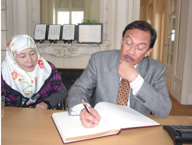
M. Anwar Ibrahim et son épouse, au Siège de l'UIP à Genève, 2005