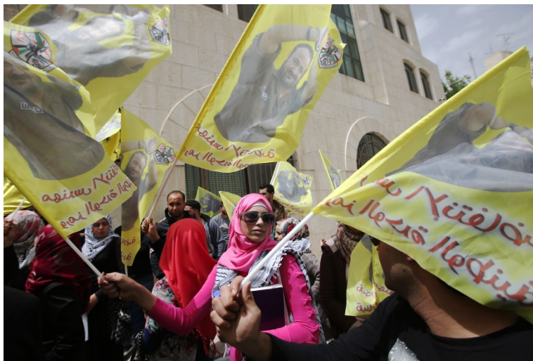
Ramallah, 15 avril 2015 - Des manifestants palestiniens brandissent des portraits du dirigeant du Fatah, Marwan Barghouti, durant la marche marquant l'anniversaire de son arrestation