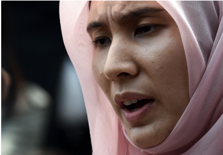
Nurul Izzah, la fille du dirigeant de l'opposition malaisienne Anwar Ibrahim, s'adresse aux journalistes après sa libération conditionnelle le 17 mars 2015.