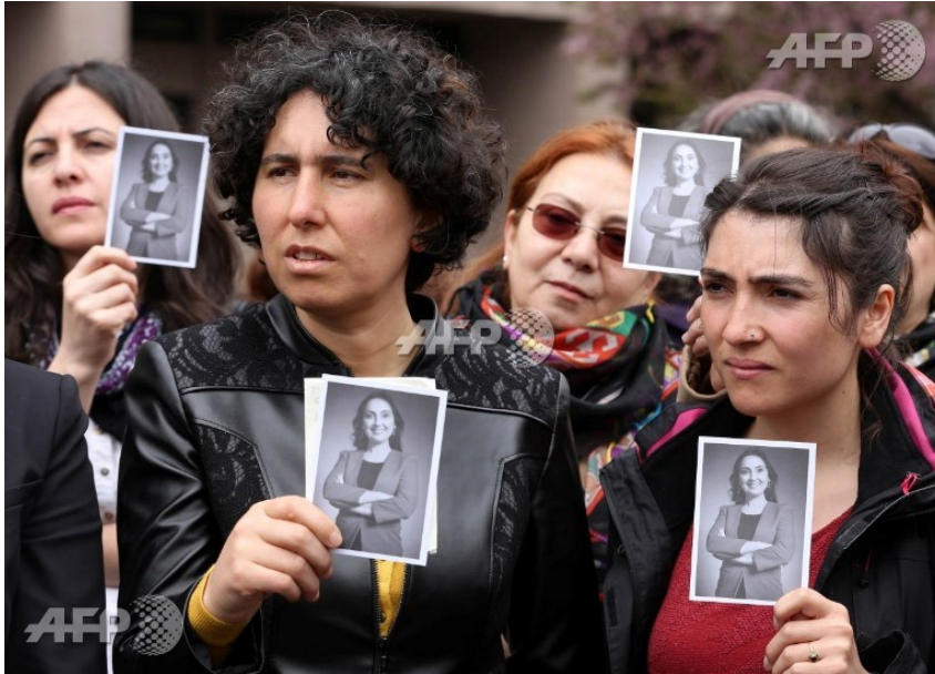
Manifestantes tenant la photo de Figen Yüksekdağ lors du procès de la co-dirigeante du Parti démocratique populaire (HDP) pro-Kurde, devant le tribunal d'Ankara le 13 avril 2017