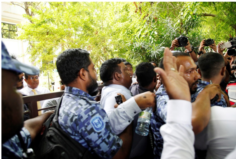
Des parlementaires sont empêchés d'entrer dans le Majlis du peuple par la police, 24 juillet 2017.