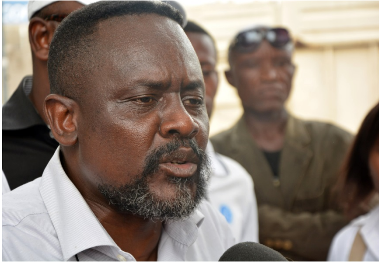
Franck Diongo, Président du MLP, Parti d'opposition congolais