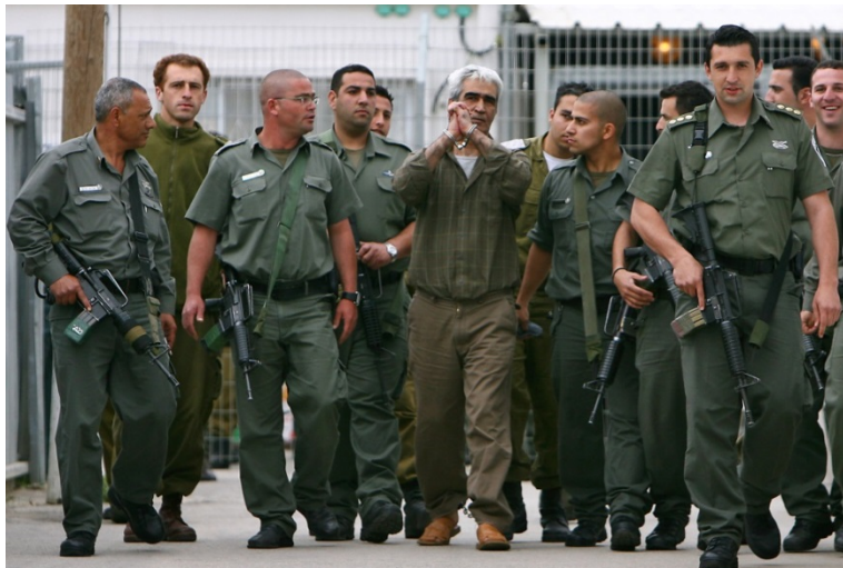
Ahmed Sa'adat, leader du Front de libération de la Palestine, est escorté par la police des frontières israélienne jusqu'au tribunal militaire d'Ofer en Cisjordanie (au nord de Jérusalem) le 27 mars 2006.