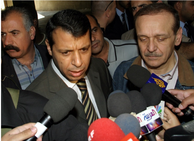
Mohamed Dahlan, ancien Ministre palestinien de la sécurité (à gauche) s'entretient avec des journalistes devant les locaux de l'Organisation de libération de la Palestine, le 8 novembre 2004.