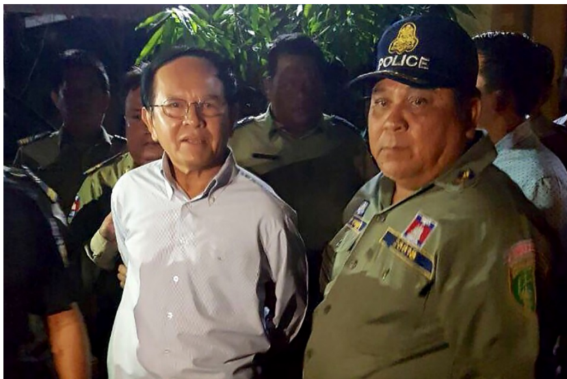
M. Kem Sokha est escorté par la police à son domicile à Phnom Penh le 3 septembre 2017