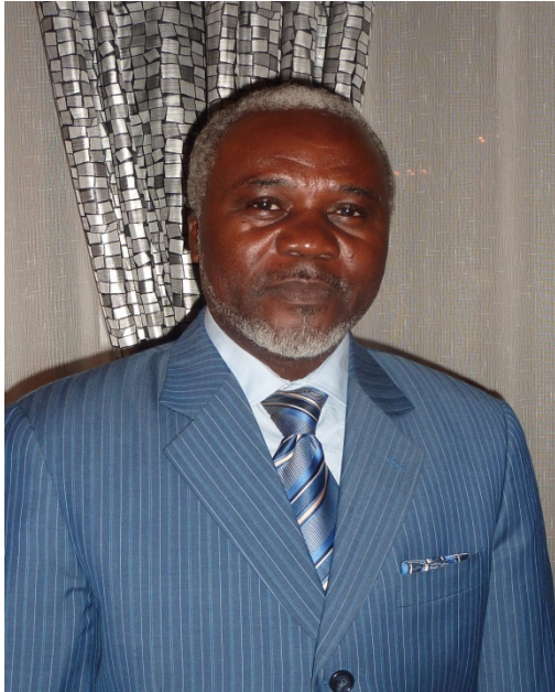
M. Mythondeke © IPU juin 2013