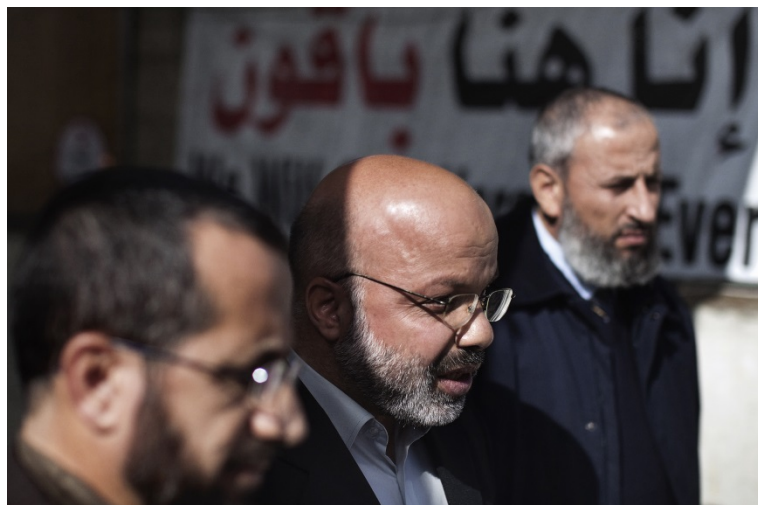
Les parlementaires du Hamas Ahmed Attoun (à droite), Mohammed Totah (deuxième à partir de la droite) and Khaled Abu Arafa (à gauche) assis devant les bureaux de la Croix-Rouge internationale où ils vivent depuis 162 jours par crainte de leur expulsion par les autorités d'Israël, 9 décembre 2010.