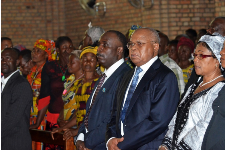
Le dirigeant de l'opposition, Etienne Tshisekedi (à droite) assiste, aux côtés du dirigeant de l'opposition Eugène Diomi Ndongala (à gauche), à une messe pour la paix à l'Est, célébrée le 22 juin 2012, en l'église Notre Dame de Kinshasa, après des heurts entre l'armée et d'anciens rebelles de l'Est dans les régions proches du Rwanda et de l'Ouganda