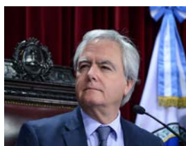
M. Federico Pinedo (Argentine)