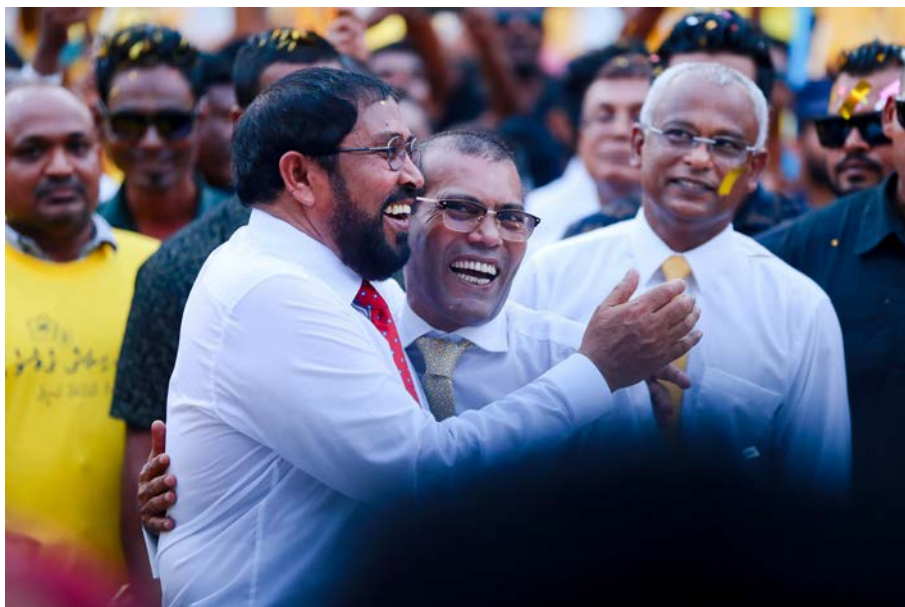
Mohamed Nasheed (C), ancien Président des Maldives, est enlacé par Qasim Ibrahim (G), dirigeant du Parti Jumhoory, alors que le Président élu Ibrahim Mohamed Solih, vient l'accueillir à Male, le 1 er novembre 2018, aux Maldives, à son retour d'exil.

Décision adoptée par le Comité des droits de l'homme des parlementaires à sa 158 ème session (Genève, 8 février 2019)