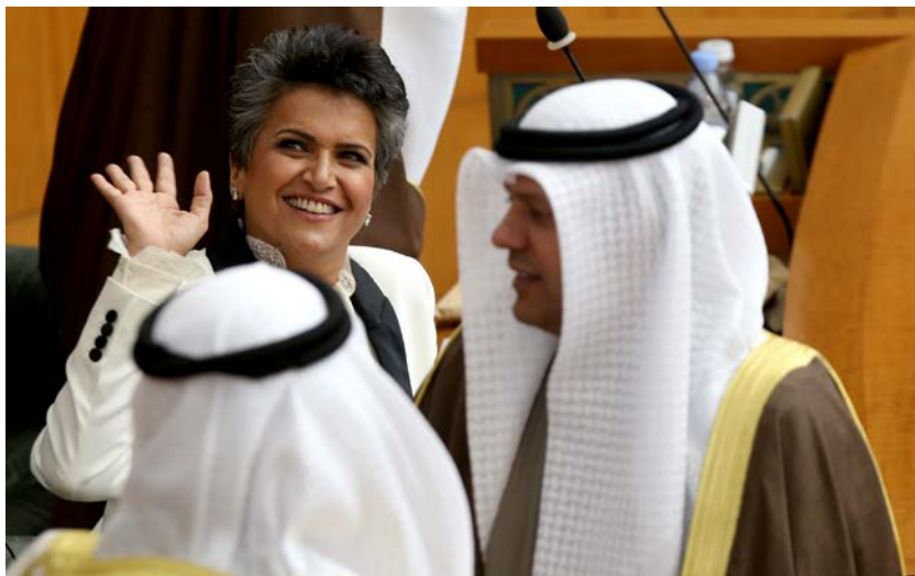
Safa Al-Hashem, membre du parlement koweïtien adresse un salut lors de la séance inaugurale du nouveau parlement le 11 décembre 2016

Décision adoptée par le Comité des droits de l'homme des parlementaires à sa 158 ème session (Genève, 8 février 2019)