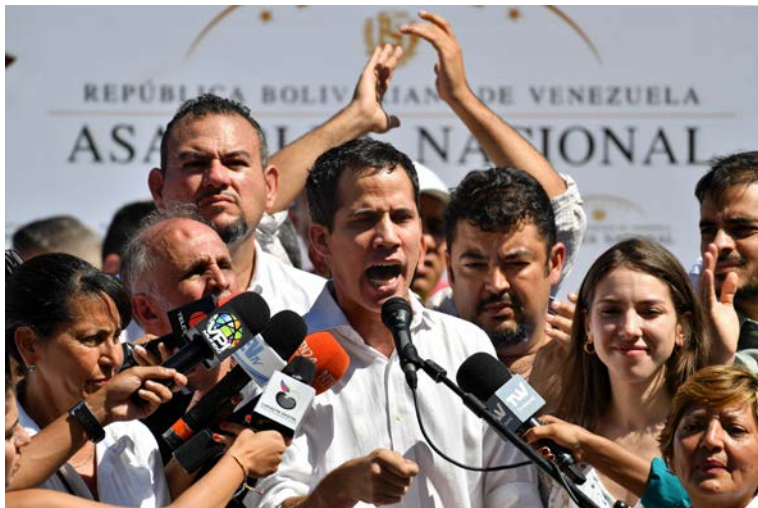
Le Président de l'Assemblée nationale vénézuélienne, Juan Guaidó, s'adresse aux soutiens de l'opposition lors d'un rassemblement à Caraballeda, au Venezuela, le 13 janvier 2019

Décision adoptée par le Comité des droits de l'homme des parlementaires à sa 158 ème session (Genève, 8 février 2019)