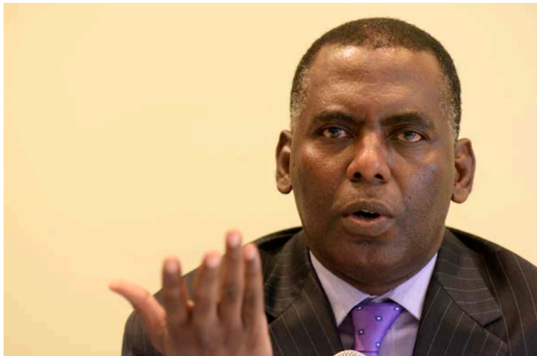
Biram Dah Abeid, homme politique mauritanien, défenseur de l'abolition de l'esclavage, lors d'une conférence de presse à Dakar, le 29 septembre 2016

Décision adoptée par le Comité des droits de l'homme des parlementaires à sa 158 ème session (Genève, 8 février 2019)