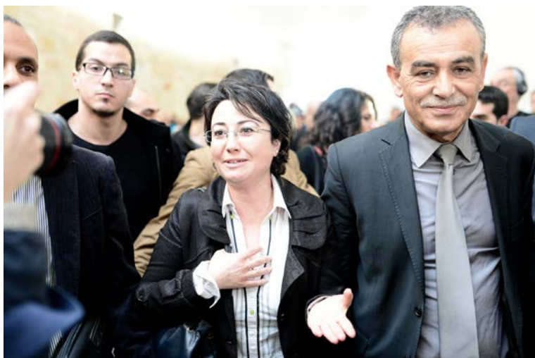
Haneen Zoabi (C), membre arabe de la Knesset, et Jamal Zahalka (D) s'adressant à la presse le 14 février 2015

Décision adoptée par le Comité des droits de l'homme des parlementaires à sa 158 ème session (Genève, 8 février 2019)