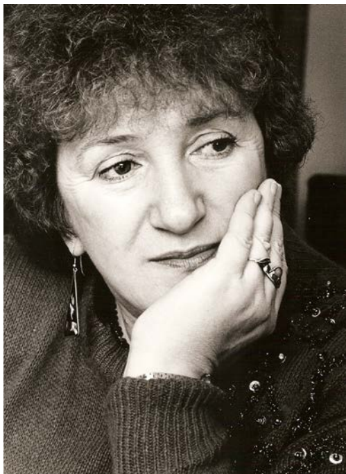
Galina Starovoitova

Décision adoptée par le Comité des droits de l'homme des parlementaires à sa 158 ème session (Genève, 8 février 2019)