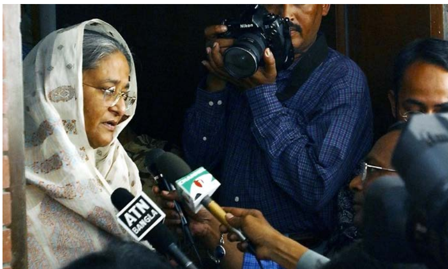
Sheikh Hasina Wajed (G), dirigeante de la Ligue Awami, s'adresse à des journalistes devant son domicile à Dhaka, le 23 août 2004.

Décision adoptée par le Comité des droits de l'homme des parlementaires à sa 158 ème session (Genève, 8 février 2019)