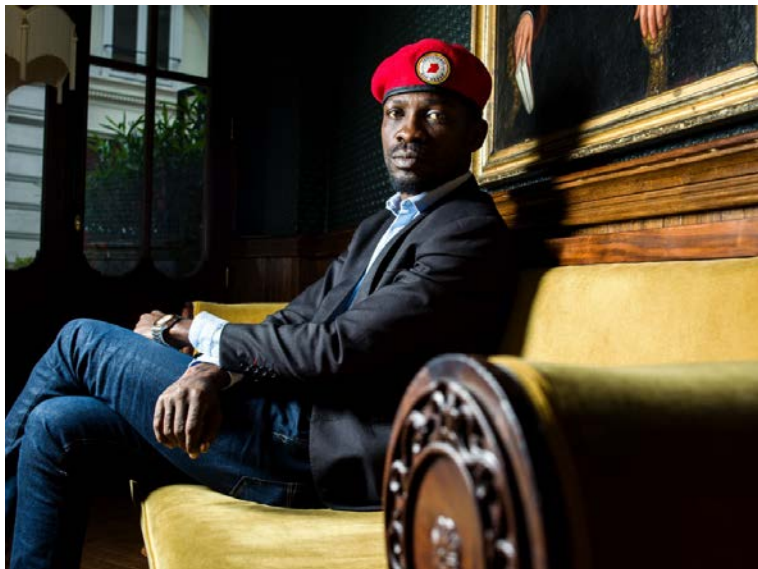
Bobi Wine, juin 2019

Décision adoptée par consensus par le Conseil directeur de l'UIP à sa 205 e session (Belgrade, 17 octobre 2019) 1