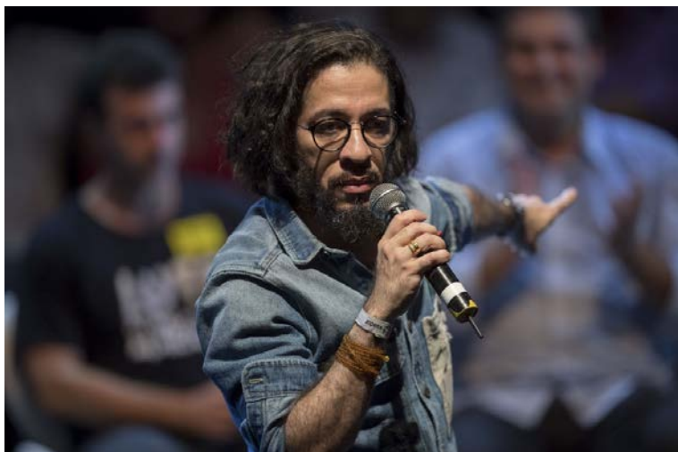
Jean Wyllys, député fédéral du Parti du socialisme et de la liberté (PSOL) de Rio de Janeiro, intervient lors d'un rassemblement de partis de gauche brésiliens au Circo Voador, à Rio de Janeiro (Brésil), le 2 avril 2018.

Décision adoptée à l'unanimité par le Conseil directeur de l'UIP à sa 205 e session (Belgrade, 17 octobre 2019)