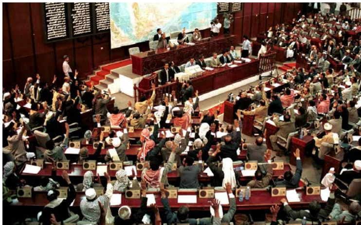
Vote des parlementaires yéménites à Sanaa, le 24 juin 2000, sur l'accord frontalier signé avec l'Arabie saoudite.

Décision adoptée par consensus par le Conseil directeur de l'UIP à sa 205 e session (Belgrade, 17 octobre 2019) 3