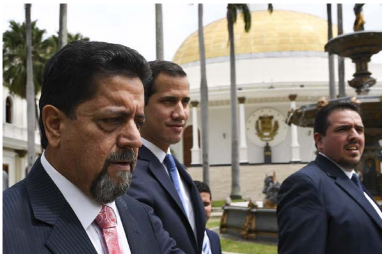
De gauche à droite, Edgar Zambrano, Vice-Président de l'Assemblée nationale, Juan Guaidó, Président de l'Assemblée nationale, et Stalin González, deuxième Vice-Président de l'Assemblée nationale, arrivant à une séance de l'Assemblée nationale à Caracas le 24 septembre 2019

Décision adoptée à l'unanimité par le Conseil directeur de l'UIP à sa 205 e session (Belgrade, 17 octobre 2019)