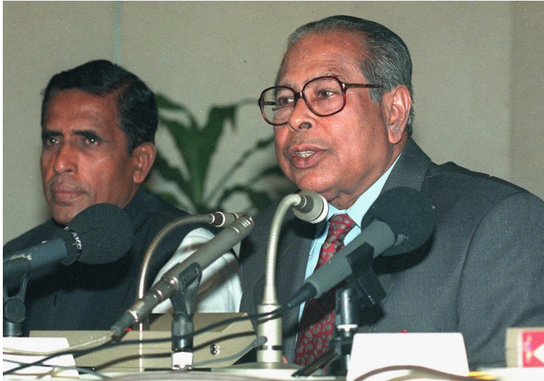
Shah Ams Kibria (à droite) présente le budget national au parlement le 13 juin 1997

Décision adoptée à l'unanimité par le Conseil directeur de l'UIP à sa 213 e session (Genève, 27 mars 2024)