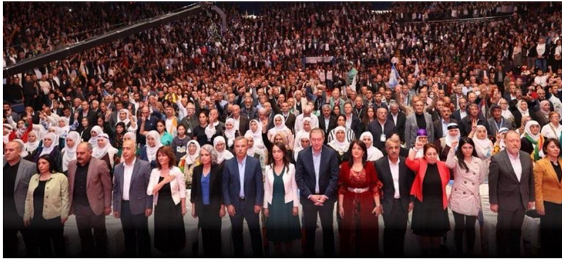
Parti de l'égalité et de la démocratie des peuples (DEM) le 15 octobre 2023 à Ankara.

Décision adoptée par consensus par le Conseil directeur de l'UIP à sa 216 e session (Genève, 23 octobre 2025) 1