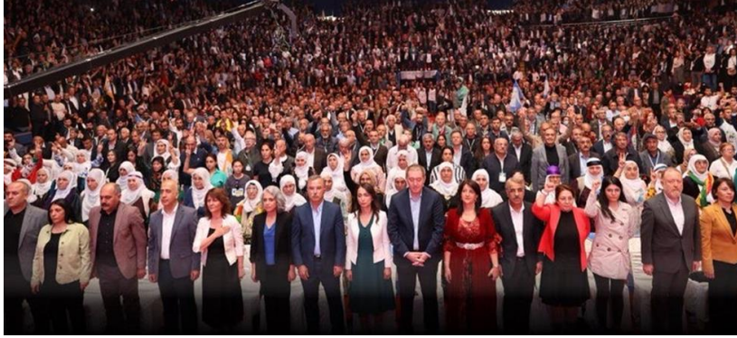
Parti de l'égalité et de la démocratie des peuples (DEM), le 15 octobre 2023 à Ankara.

Décision adoptée à l'unanimité par le Conseil directeur de l'UIP à sa 217 e session (Istanbul, 19 avril 2026)