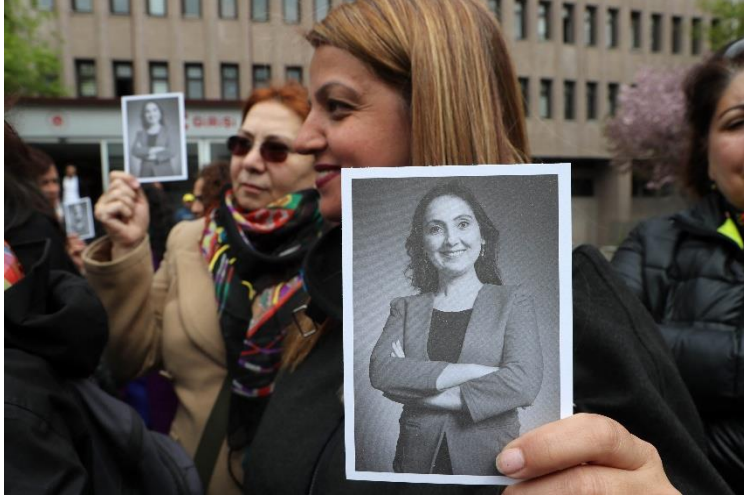
Une manifestante brandit une photo de Figen Yüksekdağ pendant le procès de la codirigeante du parti pro-kurde Parti démocratique populaire (HDP) devant le tribunal d'Ankara, le 13 avril 2017.

Décision adoptée à l'unanimité par le Conseil directeur de l'UIP à sa 217 e session (Istanbul, 19 avril 2026)