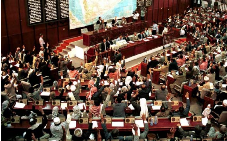
Vote des parlementaires yéménites à Sanaa, le 24 juin 2000, sur l'accord frontalier signé avec l'Arabie saoudite.

Décision adoptée par consensus par le Conseil directeur de l'UIP à sa 205 e session (Belgrade, 17 octobre 2019) 1