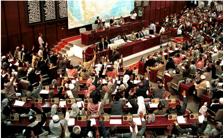
Vote des parlementaires yéménites à Sanaa, le 24 juin 2000, sur l'accord frontalier signé avec l'Arabie saoudite le 12 juin.

Décision adoptée par le Comité des droits de l'homme des parlementaires à sa 162 e session (réunion en ligne, 31 octobre 2020)